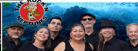
THE ROCK'N NEPTUNES