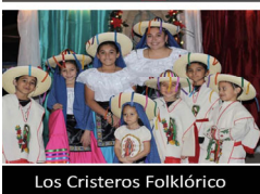
Los Cirsteros Folklorico